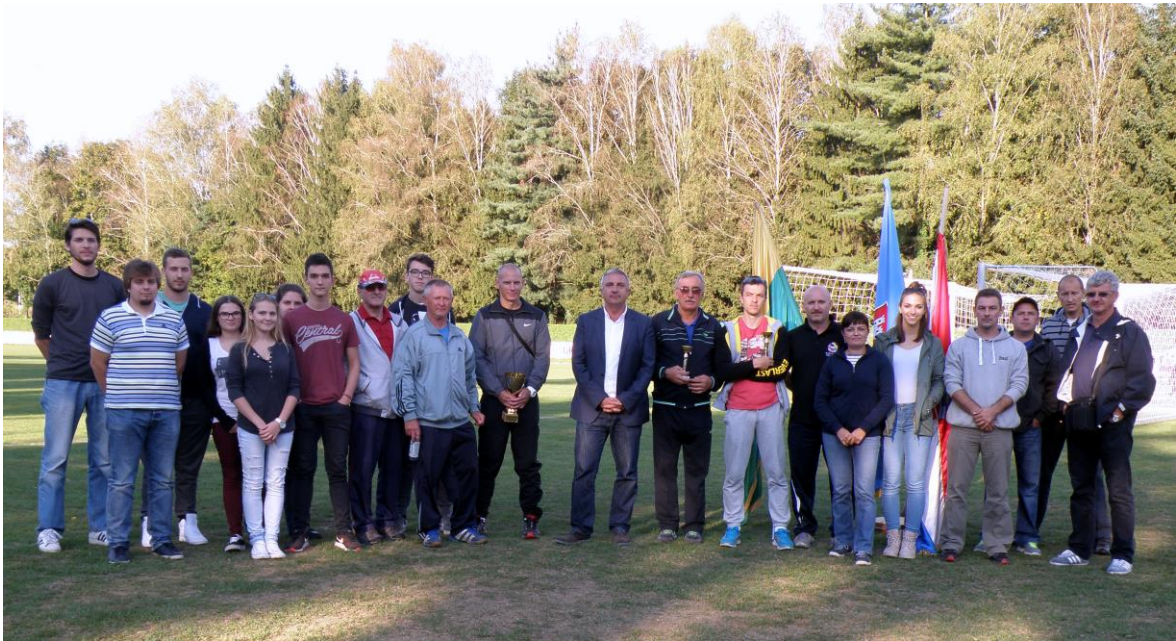
Organizacijski odbor „34. Krosa grada Daruvara“